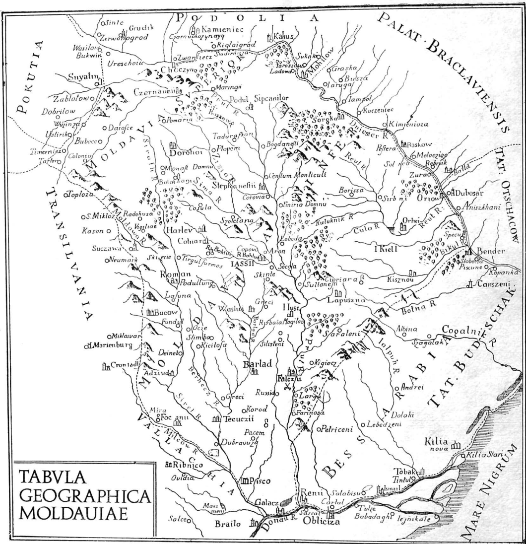
TABVLA GEOGRAPHICA MOLDAUIAE